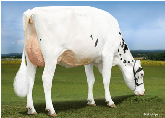
LADYS-MANOR GRNT OOHM DAM